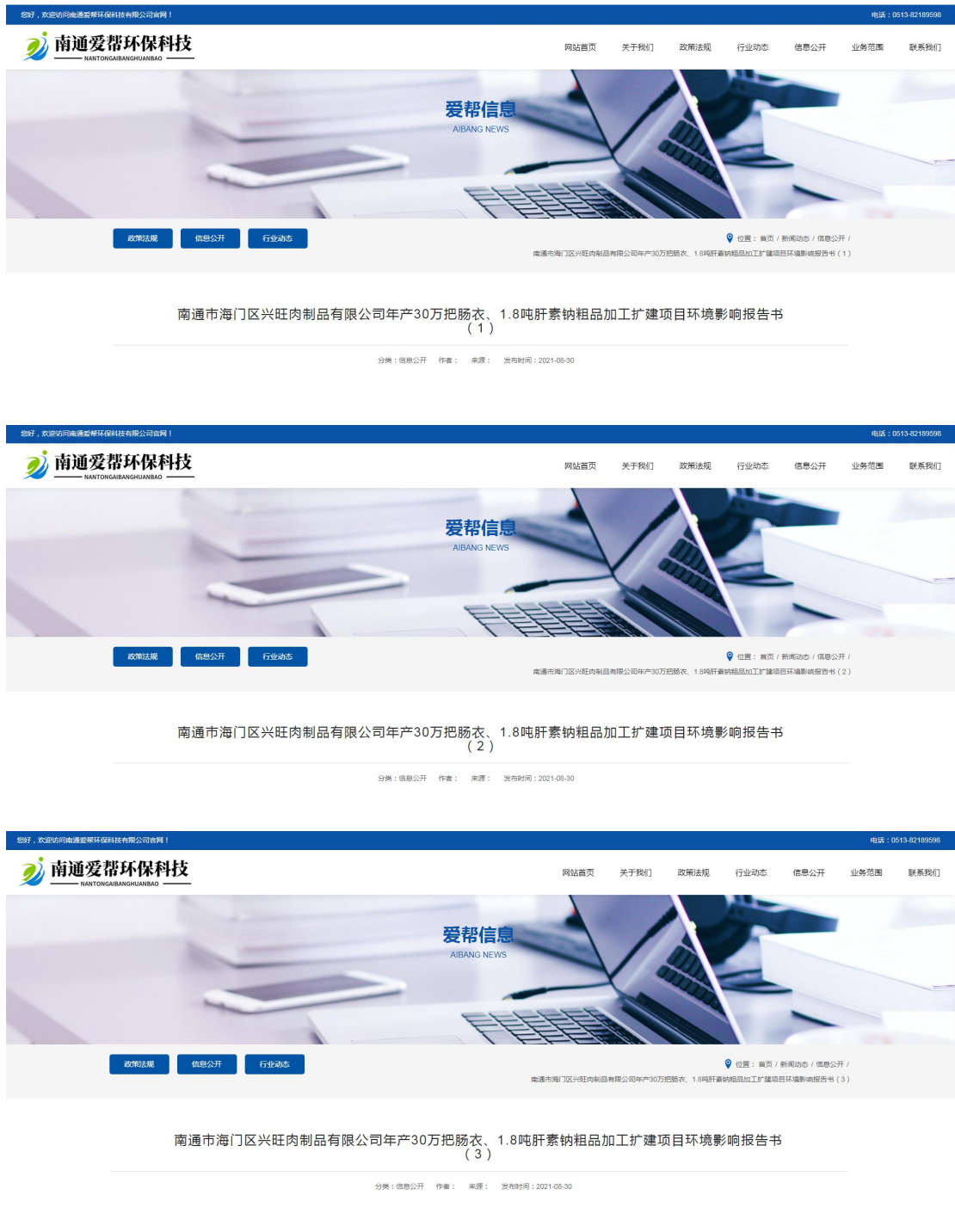
图 6-1 公众参与说明及报批稿网络公示截图